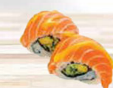
44. SALMON & MANGO zalm & mango