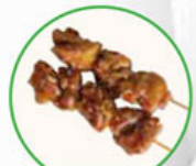
54. YAKITORI chicken skewers kipspies