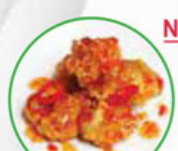
68. SWEET & SOUR CHICKEN kipstukjes in zoetzure saus