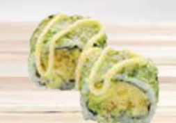
38. CRISPY MAYO krokante rol