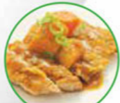
79. CHICKEN CURRY kip met Japanse kerrie saus