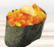
17. SALMON TARTAR zalm tartaar