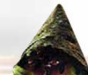
22. TUNA tonijn handroll