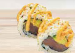
37. SPICY TUNA pikante tonijn