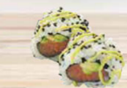
41. SALMON & WASABI-MAYO zalm & wasabi-mayo