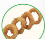
71. FRIED SQUID RINGS inktvisringen