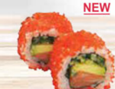
39. CALIFORNIA SALMON salmon & shrimp eggs zalm & garnaalkuit