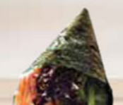
19. CALIFORNIA crab & shrimp eggs handroll krab & garnaalkuit