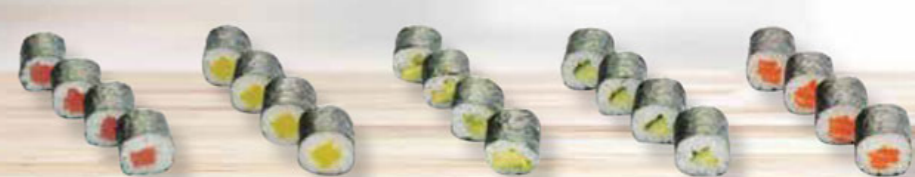
27. TEKKA tuna / tonijn