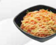
51. CRAB SALAD krab salade