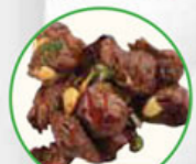
75. BEEF TERIYAKI beef blokjes met teriyaki saus