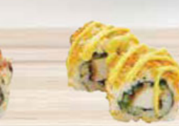
33. CHICKEN / curry-mayo kip met kerrie-mayo