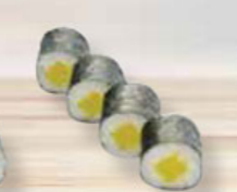
28. OSHINKO marinated rettich gemaarineerde rettich