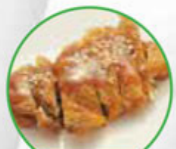
78. CHICKEN TERIYAKI kip teriyaki