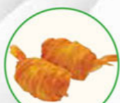
67. SHRIMP CROQUETTES garnalen krokettes