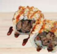
32. SPICY BEEF pikante beef