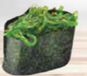
16. SEAWEED zeewier