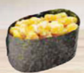
14. CORN SALAD maïssalade