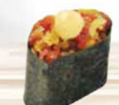
18. TUNA TARTAR tonijn tartaar