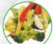
59. STIR-FRIED VEGETABLES gebakken groenten