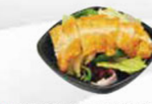
52. CRISPY CHICKEN SALAD krokante kipsalade