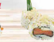
35. SALMON & CREAMCHEESE zalm & roomkaas