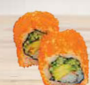
36. CALIFORNIA crab & shrimp eggs krab & garnaalkuit