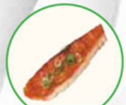
81. GRILLED SALMON gegrilde zalm