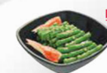
46. GREEN BEANS WITH SESAME DRESSING haricots verts met sesam dressing