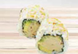
42. TUNA & AVOCADO tonijn & avocado