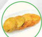
61. VEGGIE TEMPURA eggplant, sweet potato aubergine, z. aardappel