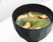
45. MISO SOUP soybean soup sojabonen soep