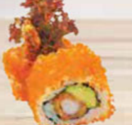
40. EBI TEMPURA deep-fried shrimp garnaal & avocado