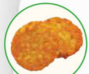
62. POTATO FRITTERS aardappelkoekjes