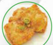
82. GRILLED WHITE FISH gegrilde witvis