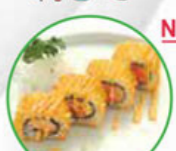
69. DEEP-FRIED SALMON SUSHI gefrituurde zalm sushi