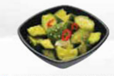
53. SWEET & SOUR SALAD zoetzure komkommers