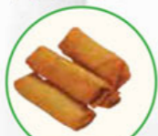
64. SPRINGROLLS mini loempia's