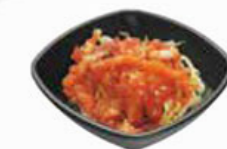
48. SASHIMI SALAD fresh raw fish salad verse vis salade