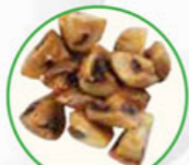
58. MUSHROOM champignon