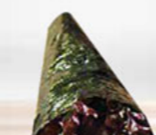
21. SALMON zalm handroll