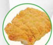
65. TORI KARAAGE crispy chicken krokante kip