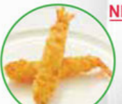
60. EBI FRY fried shrimps gefrituurde garnalen