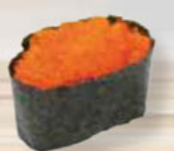
15. EBIKO shrimp eggs garnaalkuit