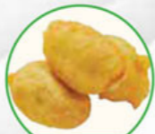
95. FRIED BANANA with icing sugar gebakken banaan / poedersuiker