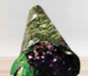
20. SEAWEED zeewier handroll