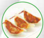
63. GYOZA Japanese chicken dumplings Japanse kippastei