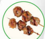
56. CHICKEN MEATBALLS kipgehakt balletjes