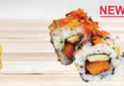
34. SWEET POTATO zoete aardappel & avocado