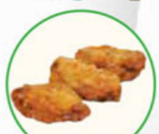
66. SALT & PEPPER CHICKEN WINGS gekruidde kippenvleugels